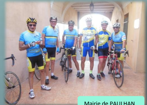
Mairie de PAULHAN

Sans perdre de temps, nous nous dirigeons vers Pézenas via St Thibery. Troisième tampon à la Mairie de Paulhan, puis une petite pause à hauteur d'Aspiran sur la RD 609 (pour évacuer le trop plein !!!), et en route vers Clermont. Le vent du nord se fait maintenant bien ressentir, car nous l'avons de face, et ce depuis Pézenas. Première difficulté de la journée : Il faut monter à Lacoste. Regroupement au sommet, et l'on se laisse glisser jusqu'à Lodève, en longeant l'autoroute, où les files de voitures n'en finissent plus !